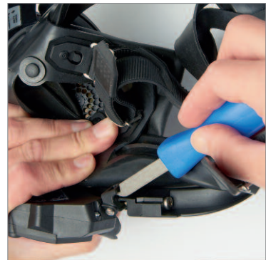
Auricular con cuello cisne: perfecto posicionamiento para cualquier tipo de cabeza